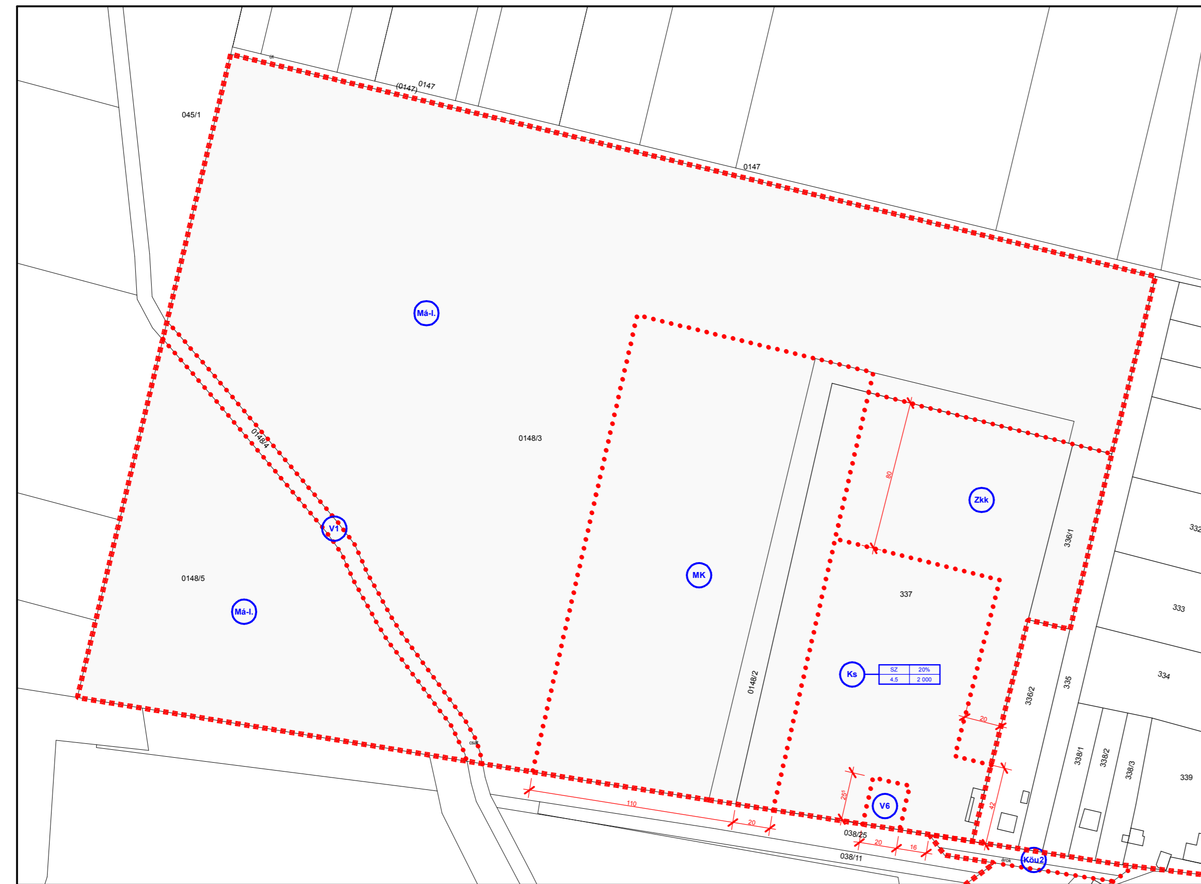
Sportpálya és környéke (6. melléklet)